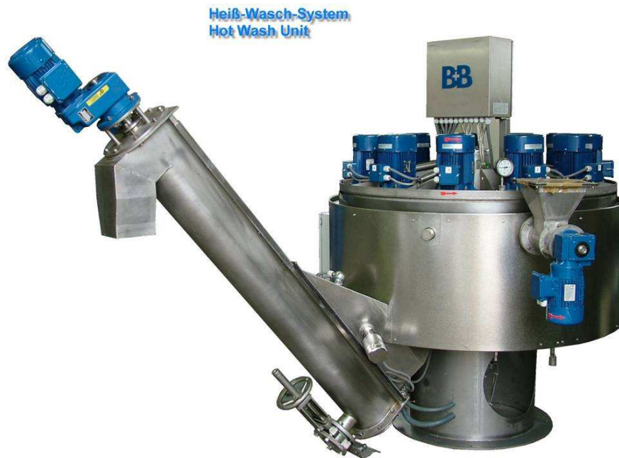
Heiß-Wasch-System Hot Wash Unit